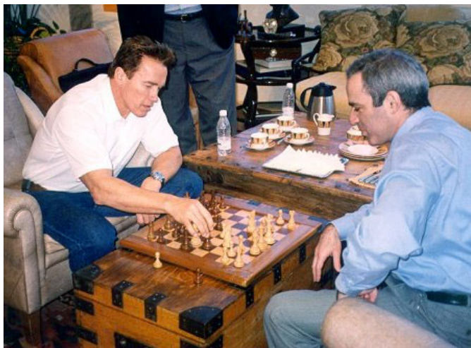
Garry Kasparov e Arnold Swartzenegger