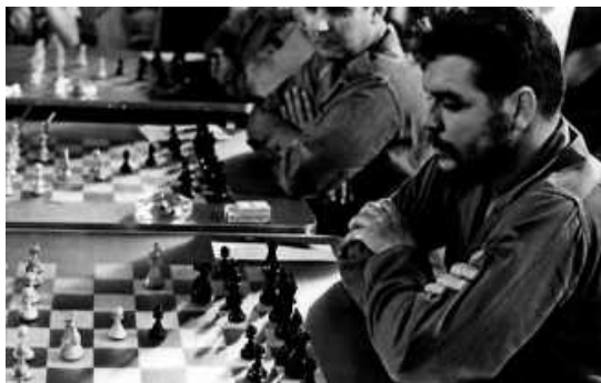
Che Guevara gioca una simultanea (1966)