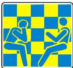
Club 64 Modena